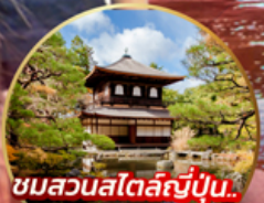
ชมสวนสไตล์ญี่ปุ่น.. Ginkakuji Temple