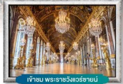
เข้าชม พระราชวังแวร์ซายน์