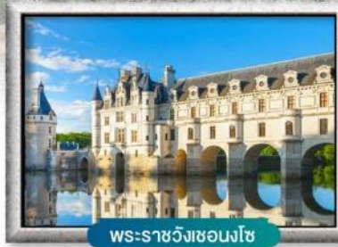
พระราชวังชองงโซ