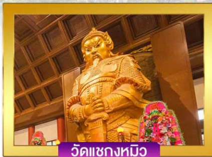
วัดแซงกหมิว