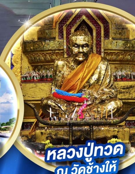
หลวงพ่อทวด ณ วัดช้างให้