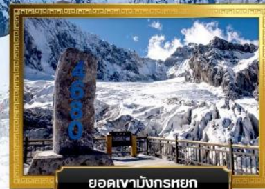
ยอดเขามังกรหยก