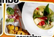
อาหารไทย ในยุโรป

✈ บินทรุ TURKISH AIRLINES FULL SERVICE น้ำหนักกระเป๋า 30 kg.