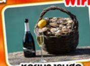
หอยนางรมสด กับไวน์ขาว