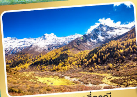
อุทยานภูเขาสั้ดรุณี