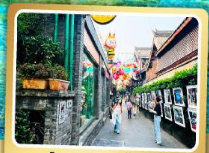
ถนนโบราณชอยกวางชอยแคบ