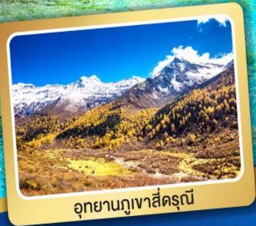
อุทยานภูเขาสี่ดรุณี