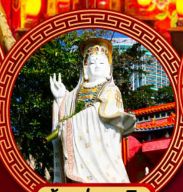
เจ้าแม่กวนอิม รีพัลส์เบย์