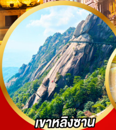
เว้าหลิงซาน