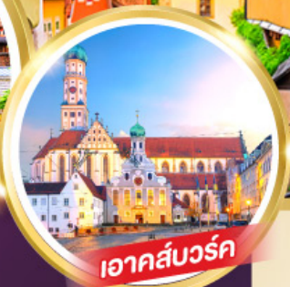
เอาคส์บวร์ค