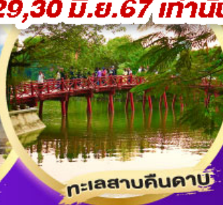
ทะเลสาบคินคาบ