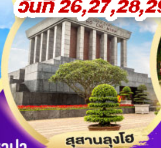
สุสานลุงโฮ