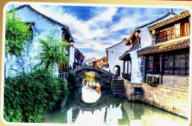
เมืองโบราณเยี่ยเหอ