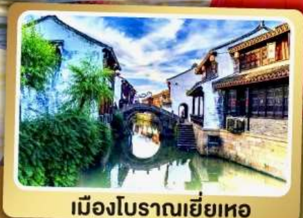
เมืองโบราณเยี่ยเหอ