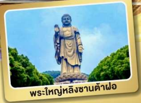
พระใหญ่หลังซานต้าฝอ