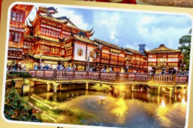
ตลาดร้อยปีเจิ้งหวังเมี่ยว