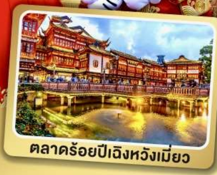
ตลาดร้อยปีเฉิงหวังเหมียว