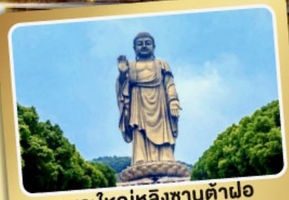
พระใหญ่หลิงซานต้าฝอ

เมนูพิเศษ! ซีโครงหมูอู๊ชิ, เสี่ยวหลงเปา, ชาบูหมาล่า