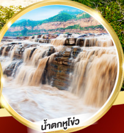
น้ำตกหูโจว