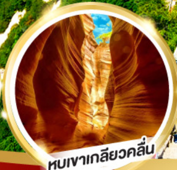
หุบเขาเกลียวคลื่น