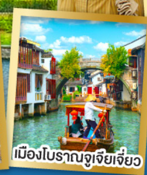
เมืองโบราณจู่เจียเจี้ยว