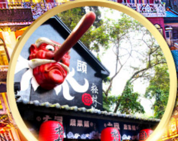
หมู่บ้านปิตาจอ