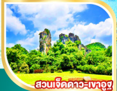
สวนเจ็ดดาว-เขาอูจู่