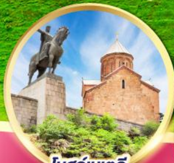
โบสถ์เมเตคี