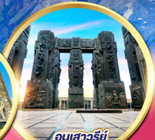
อนุสาวรีย์ ประวัติศาสตร์จอร์เจีย