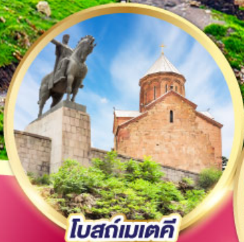
โบสถ์เมคคี