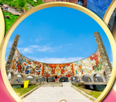
อนุสรณ์สถาน รัสเซีย-จอร์เจีย