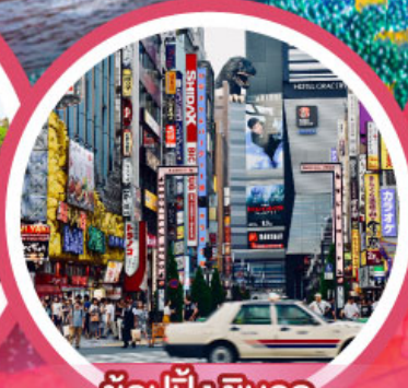
ช้อปปิ้งชินจูกุ