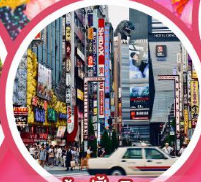
ช้อปปิ้งชินจูกุ