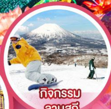
กิจกรรม ลานสกี

เดินทาง 18-23, 21-26 ก.พ. 68 14-19, 20-25 ก.พ. 68