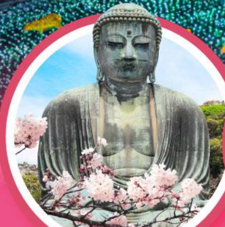
หลวงพ่อดโตโตบุตสึ