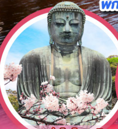
หลวงพ่อโต ไคบุตสึ