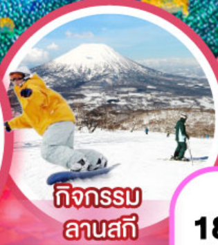
กิจกรรม ลานสกี

เดินทาง 18-23, 21-26 ก.พ. 68 14-19, 20-25 ก.พ. 68