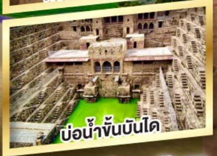
บ่อน้ำขั้นบันได