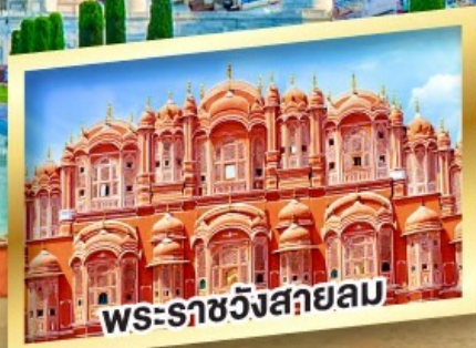
พระราชวังสกายลม