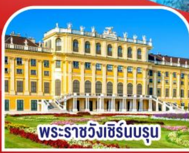
พระราชวังเฮ็ร์นบรูม