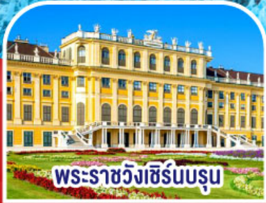
พระราชวังเซิร์นบรูม