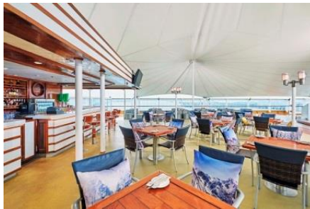
เรือล่อง น่านน้ำสากล