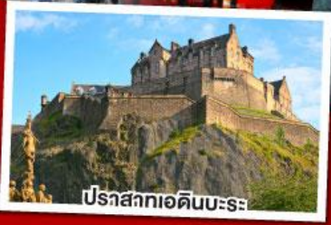
ปราสาทเอดิเนบะระ