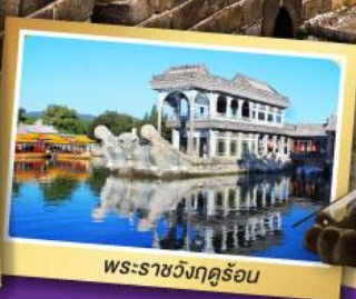
พระราชวังฤดูร้อน

เที่ยวเต็มอิ่ม ไม่ลงร้านช้อปปิ้ง พักดี 4 ดาว ★★★★★