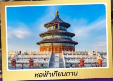
หอฟ้าเทียนถาน