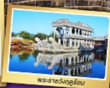
พระราชวังฤดูร้อน