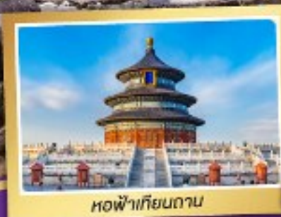
หอฟ้าเทียนถาน