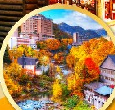
เมืองโจเซ็งเค