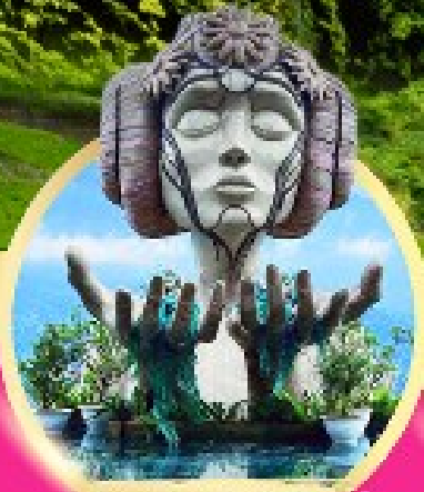
โมอาน่า ซาปา คาเฟ่