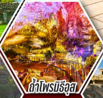
ด้าไฟรมีริอุส