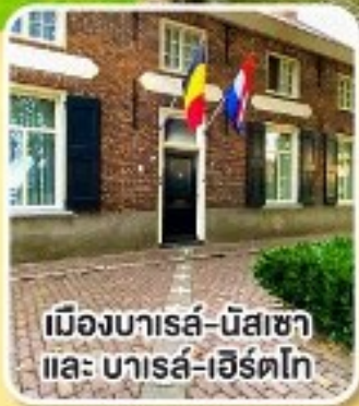
เมืองบารส์-นัสซา และ บารส์-เฮิร์ตโท