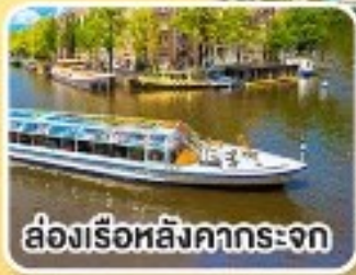
ล่องเรือหลังคากระจก

พิเศษ!! เมนูหอยแมลงภู่อบไวน์ขาว ล่องเรือหมู่บ้านไร้ถนน ที่รูน