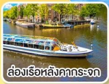
ล่องเรือหลังคากระจก

พิเศษ!! เมนูหอยแมลงงูอบไวน์ขาว ล่องเรือหมู่บ้านไร้ถนน ที่จอร์น