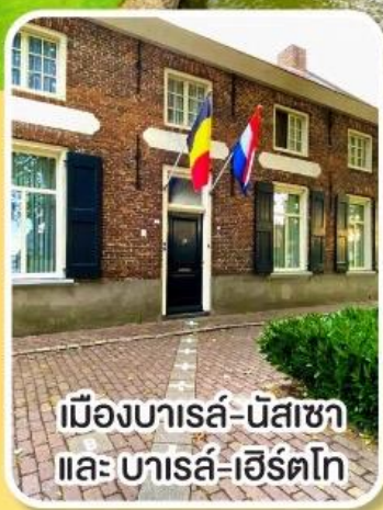
เมืองบารส์-นัสซา และ บารส์-เฮิร์ตโก