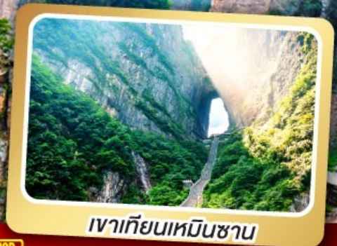
เวาเทียนเหมินซาน

ทริปเดียวเที่ยว 2 เมืองโบราณ ฟูหยงและเฟิ่งหวง