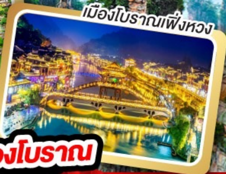
เมืองโบราณเฟิ่งหวง