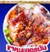
พาสต้าเยอรมัน