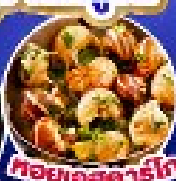
คอตยอสตาร์ท

เดินทาง 5 17-25 ก.ย.67/11-19,18-26 ต.ค.67 14-22 พ.ย.67/30 พ.ย.-8 ธ.ค.67 25 ธ.ค.67 - 2 ม.ค.68(เทศกาลปีใหม่)