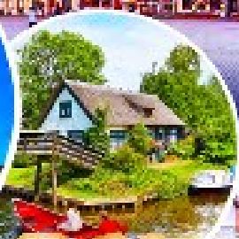
หมู่บ้านกีธูร์น