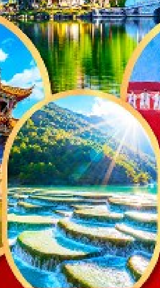
หุบเขาสีน้ำเงิน