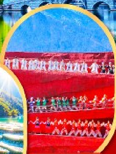
โชว์ Impression Lijiang