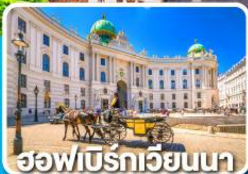
ฮอฟบิรทเวียนนา