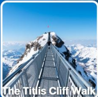
The Titlis Cliff Walk