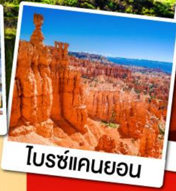
โบรซ์แคนยอน