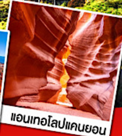
แอนเทโลปแคนยอน