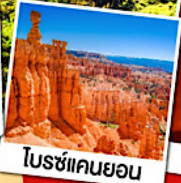
โบรซ์แคนยอน