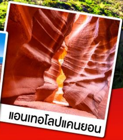
แอนเทอโลปแคนยอน