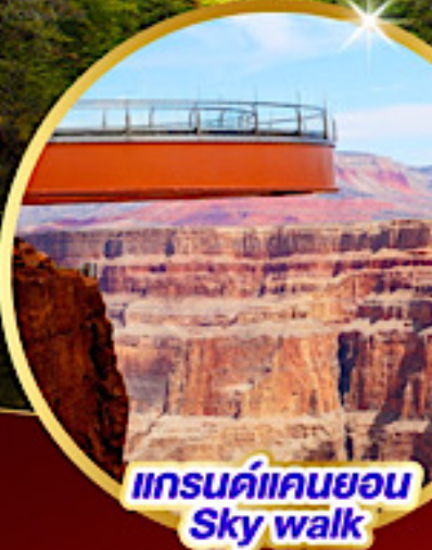
แกรนด์แคนยอน Sky walk