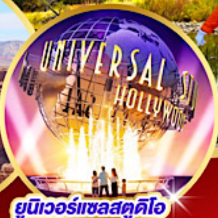
ยูนิเวอร์แซลสตูดิโอ