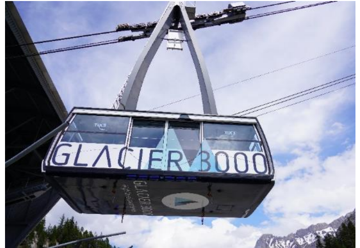
Highlight ! กระเช้าไฟฟ้าขนาดยักษ์ที่จุผู้โดยสารได้ถึง 125 คน

เช้า ๑๑ รับประทานอาหารเช้า ณ โรงแรม (มื้อที่9) นำท่านเดินทางสู่ หมู่บ้านโคล เดอ ปียง (Col De Pillon) ประเทศสวิตเซอร์แลนด์ (ระยะทาง 292 กม. / 4.30 ชม.) เป็นที่ตั้งของสถานี จากนั้นนำท่านนั่งกระเช้าลอยฟ้า สู่ ยอดเขากลาเซียร์ 3000 (Glacier 3000) มีความสูงเกือบ 3,000 เมตรเหนือระดับน้ำทะเล ชมทิวทัศน์อันงดงามของท้องฟ้าและเทือกเขามากมายแบบพาโนรามา และให้ท่านทำกายภาพสูงเดินบนสะพาน "The Peak Walk by Tissot" สะพานแขวนที่มีความยาว 107 เมตร ข้ามหน้าผาที่ระดับความสูง 3,000 เมตร ทำให้เป็นสะพานแขวนที่สูงที่สุดในโลก อีสาระให้ท่านสนุกสนานกับกิจกรรมตามอัธยาศัย (ราคาทัวร์รวม Peak walk and View point / Glacier Walk / Ice Express (chairlift) / Fun Park กรุณาเช็คเครื่องเล่นต่างๆ กับหัวหน้าทัวร์อีกครั้ง)