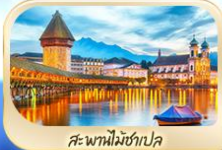
สะพานไม้ชาเปล