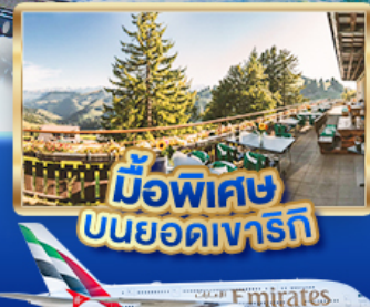
มือพิเศษ บนยอดเขารัก