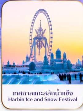
เทศกาลแกะสลักน้ำแข็ง Harbin Ice and Snow Festival