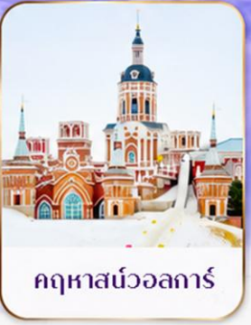
คฤหาสน์วอลการ์