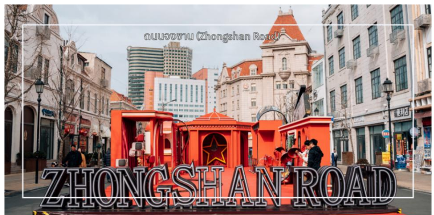
ถนนจงซาน (Zhongshan Road)

นำท่านเดินชมบรรยากาศบน ถนนจงซาน (Zhongshan Road) ถนนสายเก่าแก่ใจกลางเมืองชิงเต่า ที่เต็มไปด้วยเสน่ห์ของอาคารสไตล์ยุโรปยุคอาณานิคมและกลิ่นอายเมืองท่าริมทะเลอันคึกคัก ถนนสายนี้ถือเป็นย่านการค้าสำคัญในอดีต ปัจจุบันเต็มไปด้วยร้านค้า ร้านอาหาร คาเฟ่ และร้านของฝากท้องถิ่นให้เลือกซื้ออย่างเพลิดเพลิน