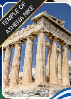
TEMPLE OF ATHENA NIKE