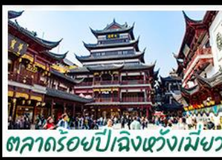
ตลาดร้อยปีเมืองหัวเหมียว