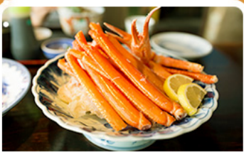
พิเศษ! ขาปู