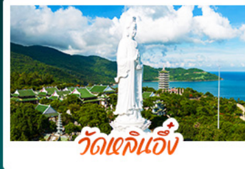
วัดเข็กนึ่ง