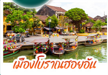
เมืองโบราณฮองอัน

สัมผัสเสน่ห์เวียดนามกลาง พักบานาฮิลล์ 1 คืน • สัมผัสอากาศเย็นตลอดปี สโตร์ฝรั่งเศสสุดคลาสสิกฟลัวร์สวรรค์ • นั่งกระเช้าสู่ยอดบานาฮิลล์ ชมสะพานมือยักษ์ แลนด์มาร์กดังระดับโลก • นมัสการเจ้าแม่กวนอิมองค์ใหญ่ที่สุดของเมืองคานัง • เช็คอินเมืองมรดกโลก พักเมืองฮองอัน 1 คืน • สนุกสนานไปกับกิจกรรม!! นั่งเรือกระดัง หมู่บ้านกัมกาน • เช็คอินร้านกาแฟ SON TRA MARINA CAFE • อิ่มอร่อยกับบุฟเฟ่ต์นานาชาติ หม้อไฟซีฟู้ด พร้อมเสิร์ฟทั้งมังกรกานละครั้งตัว