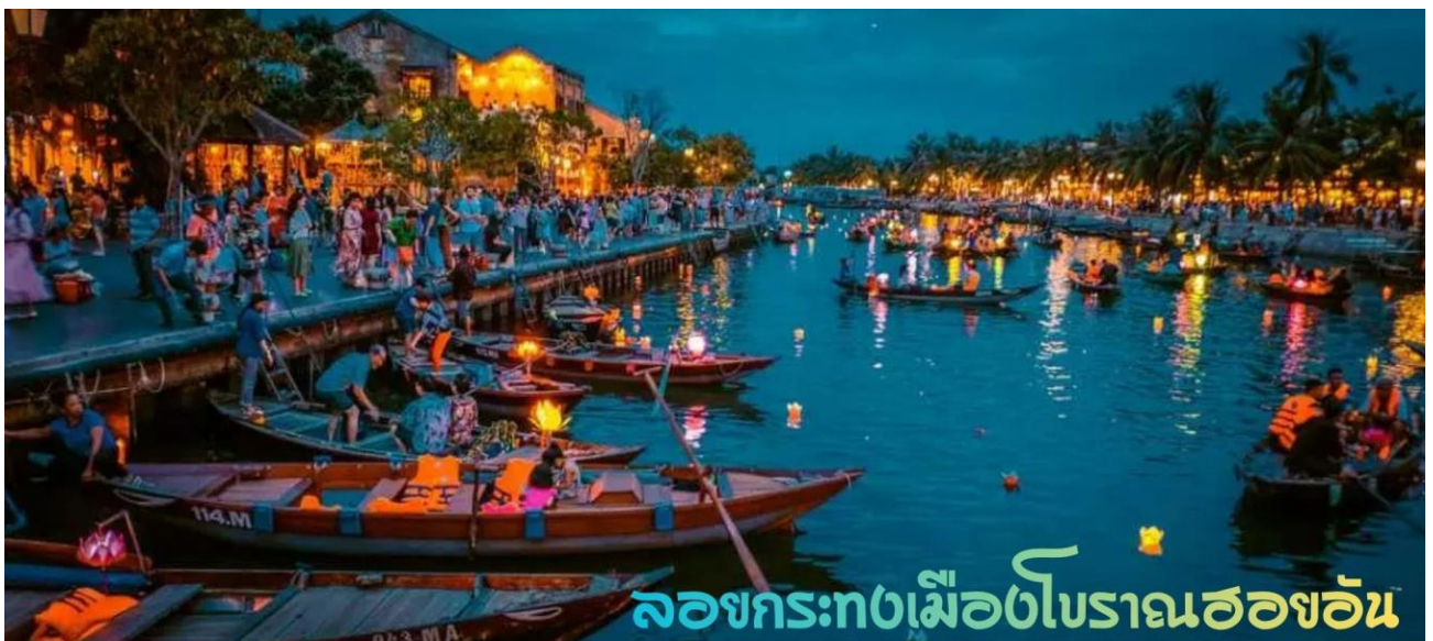
ล่องกระทงเมืองโบราณฮอยอัน

นำท่าน ล่องเรือลอยกระทง ในแม่น้ำหว่าย และเพลิดเพลินไปทิวทัศน์ของเมืองโบราณฮอยอันในยามค่ำคืน