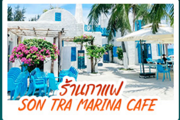
ร้านกาแฟ SON TRA MARINA CAFE