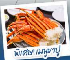
พิเศษ! เมฆหุบ