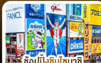
ช้อปปิ้งชินโซบาชิจิ และโดตงโบริ