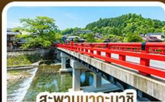
สะพานนากะบาชิจิ ทาคายาม่า