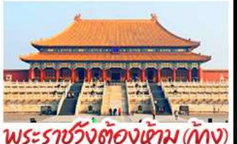
พระราชวังต้องห้าม (ปักกิ่ง)