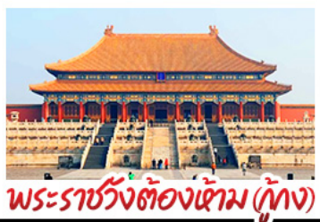
พระราชวังต้องห้าม (ปักกิ่ง)