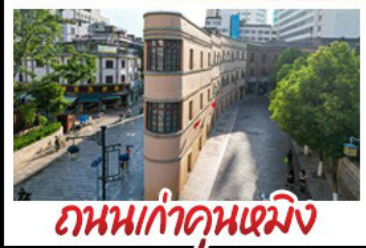
ถนนเก่าคุณเหมิง