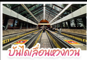
บันไดเลื่อนแขวงทวน