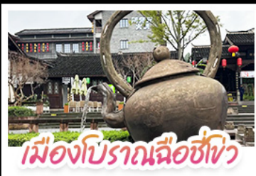
เมืองโบราณฉือชี่เซว