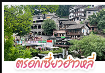
ตรอกเซี่ยวฮ่าวเสี