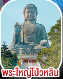
พระใหญ่โป้วหลิน