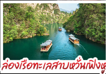
ล่องเรือทะเลสาบเขื่อนฝิงเต๋อ