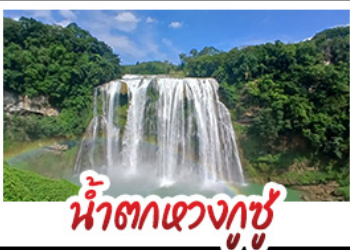
น้ำตกแขวงกู๋ชู่

14-19 พ.ย.69 ราคา 21,888 บาท / 10-15 ธ.ค.69 ราคา 19,888 บาท / 12-17 ธ.ค.69 ราคา 19,888 บาท 17-22 ธ.ค.69 ราคา 20,888 บาท / 26-31 ธ.ค.69 ราคา 23,888 บาท