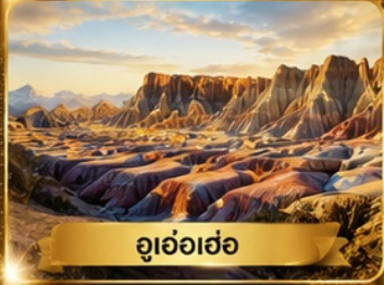
อุ่อฮ้อฮ่อ