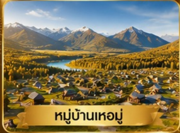
หมู่บ้านเหม่อมู่

อุหลุมู่จี • ธารน้ำห่าสี • แกรนด์แคนยอนขุยถุน • หมู่บ้านเหม่อมู่