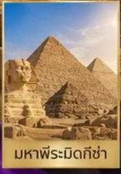
มหาพีระมิดกิซ่า